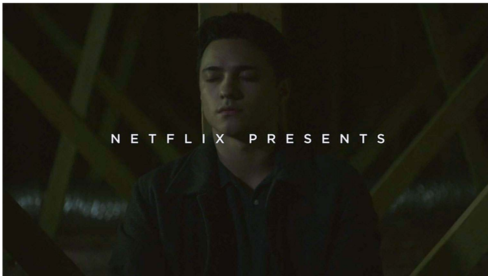
Figure 1 : Mention « Netflix Presents » à la 58 e minute du pilote de The OA (S01E01)