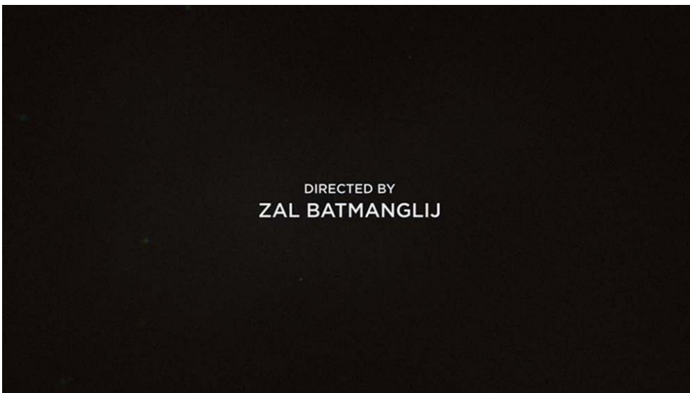
Figure 13 : Crédit de fin du réalisateur de The OA (S01E08).