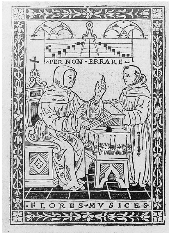
Figure 2 - Le frère Pierre de Canuntis enseignant la musique. Regule florum musices , Florence : Bernardum Zuchettam, 1510.

Mei était avant tout passionné de littérature grecque, et son évolution vers une théorie esthétique de la musique reste très liée à la poésie et aux textes. Il s'agissait là d'un courant d'idées implanté notamment à Rome, avec Nicola Vicentino. Il est clair que Vincenzo, qui sera en quelque sorte l'élève de Mei, restituera cette passion pour le texte dans son approche de la musique vocale. Mais Vincenzo était également un 'travailleur manuel', et c'est Mei qui va lui suggérer de procéder à des expériences, notamment sur l'étude des intervalles.